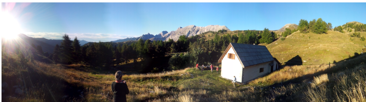
Le groupe se prépare... départ du gîte forestier de Couesto en zone centrale du Parc du Mercantour

Durée du trajet de Nice à Thorame-Haute : 2 h15. A partir de Digne-les-Bains : Train des Pignes à la gare des Chemins de fer de Provence Espace Pierre Ferrié - 04 000 Digne-Les-Bains (même bâtiment que la gare SNCF). Tél. : 04 92 31 01 58. Durée du trajet de Digne à Thorame-Haute : 1h10.